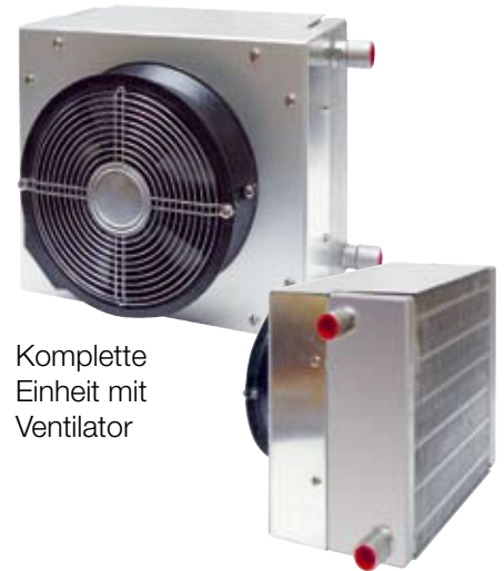
Komplette Einheit mit Ventilator